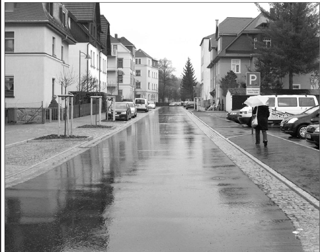
Die ausgebaute Heinrich-Heine-Straße mit ihrer neuen Straßenbeleuchtung im Stadtteil Neustadt bietet nunmehr eine attraktive Ansicht. Beidseitig angelegte Stellflächen für Pkw und neue Gehwege ergänzen das Ensemble.