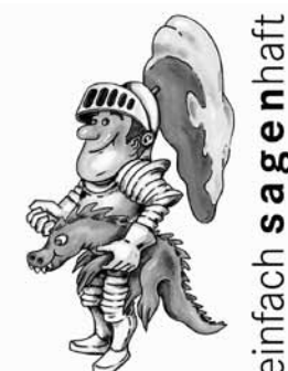
Tag der Sachsen 2013 SCHWARZENBERG

Der Countdown läuft – noch 9 Tage bis zum „Tag der Sachsen“