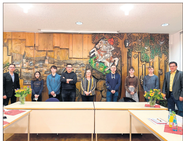
Das Kinder- und Jugendparlament tagte am 10.02.2022 im Schwarzenberger Ratssaal.